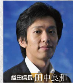
織田信長 田中良和