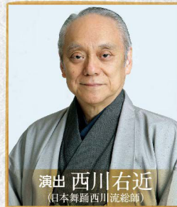
演出 西川右近 (日本舞踊西川流総師)