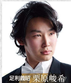
足利義昭 栗原峻希