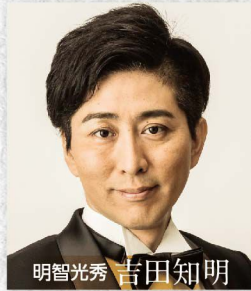
明智光秀 吉田知明